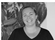
Frau Bäder 1a

Viele neue Kolleginnen und Kollegen kamen zu Beginn des Schuljahrs an unsere Schule. Wir wollen sie hier vorstellen.